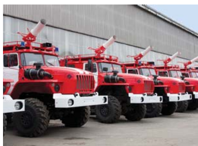
Подразделение пожарной охраны